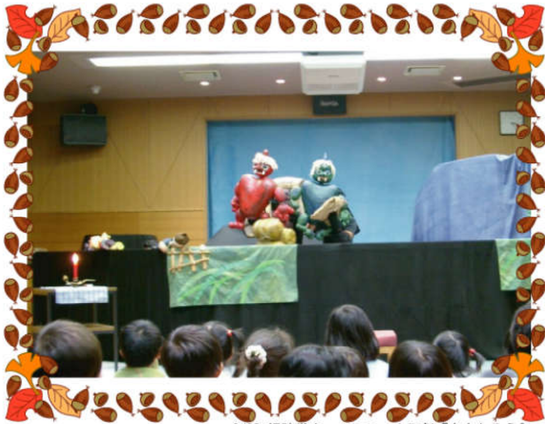
8/28 視聴覚ホールにて 人形劇『ももたろう』