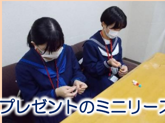
プレゼントのミニリース作成

子ども達にプレゼントするミニリースを作りました。サンタクロースに扮したジュニア司書からプレゼントをもらった子ども達のうれしそうな笑顔を見ることができました。