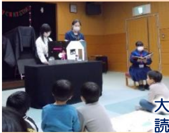
大型絵本の読み聞かせ

冬のおはなし会スペシャルを12月16日に行いました。集まった子ども達はハンドベルやブラックシアター、サンタさんの登場にとっても喜んでくれました。子ども達へのプレゼントは、今年も好評でした♪