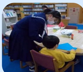
ワークショップの様子