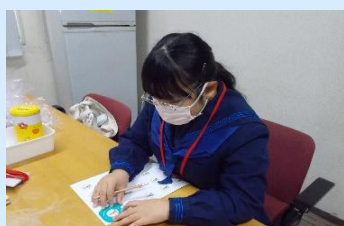
当日配付したオリジナルバッチの作成

ジュニア司書たちは、ワークショップ（ぐりとぐらの帽子づくり）や、ボードゲームで遊ぶ会にも参加し、イベントを盛りあげました。