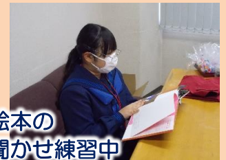
大型絵本の読み聞かせ練習中