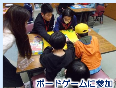
ボードゲームに参加