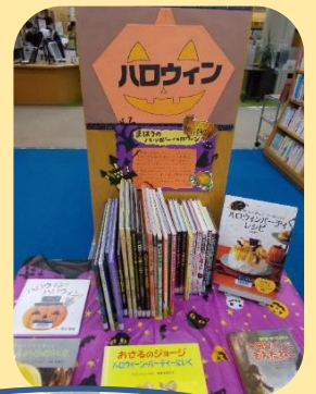
ハロウィンやクリスマス等のおすすめ本のPOP作品