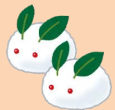
作成した装飾作品（一部）

毎月おこなっている館内展示。春夏秋冬を意識し館内に季節感を持たせるため、季節にあった色とりどりの装飾を折り紙などで作成しました。作成にも慣れてきたジュニア司書マイスターたちは、時間をかけながら手の込んだ作品を作りました。館内の所どころに展示していますので、どうぞお楽しみください。また、返架作業なども頑張りました！！