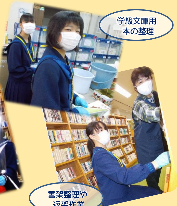
学級文庫用本の整理