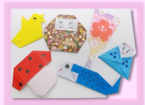
かわいい季節の飾りができました！